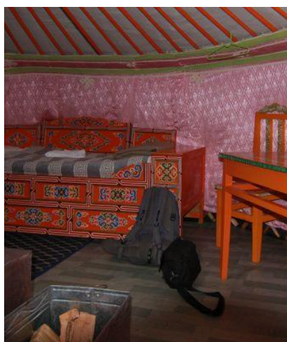
Wnętrze turystycznej jurty w Mongolii