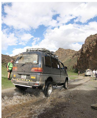
Takimi autami będziemy podróżować po Mongolii