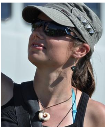
Na syberyjskie i mongolskie słońce najlepsze: czapka z daszkiem, okulary i krem z filtrem.

Na własne potrzeby (posiłki niezawarte w cenie, kawę, piwo, pamiątki) należałoby wymienić ok. 300 USD/270 EUR. Albo więcej - w zależności od apetytu, pasji kolekcjonerskich czy szczodrości w obdarowywaniu krewnych i znajomych.