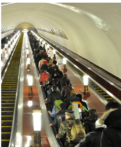
Tłok w metrze sprzyja złodziejom

Nie są wymagane żadne szczepienia obowiązkowe. Zalecane są szczepienia przeciwko żółtaczce typu A i B oraz tężcowi. Na wyjazd należy zabrać ze sobą podstawowe leki w małej ilości oraz wszelkie leki zapisane przez Państwa lekarza.