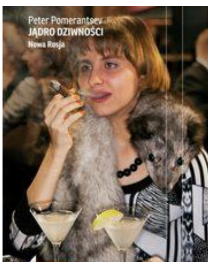
Jądro dziwności. Nowa Rosja