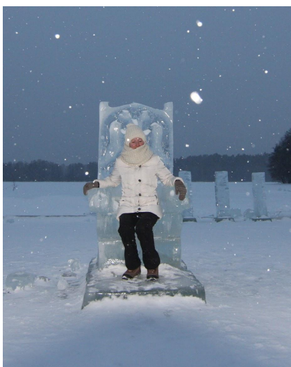
Ciepły strój to podstawa ekwipunku

Osobom mało odpornym na chłód radzimy zabranie specjalnej bielizny termicznej (kalesony, podkoszulka z długim rękawem), najlepiej z materiału z dodatkiem wełny (np. Icebreaker). Tego rodzaju odzież najściślej izoluje ciało przed zimnem.