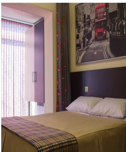
Pokój hotelowy w Murmańsku

Podczas naszej wyprawy będziemy przebywać za kotem podbiegunowym, czyli na terenach, gdzie zimą występuje noc polarna. W trakcie naszego pobytu słońce będzie pojawiać się na ok 4-5 godzin dziennie. Trzeba być więc przygotowanym na długie noce trwające mniej więcej od godziny 15 po południu do 11 przed południem.