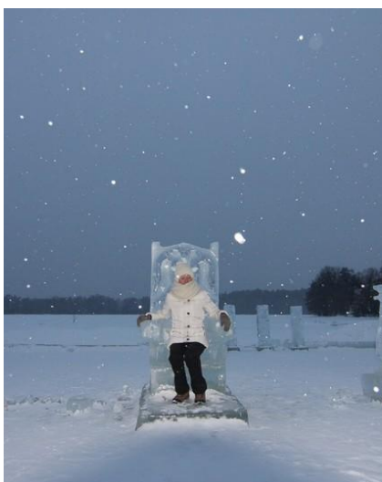
Ciepły strój to podstawa ekwipunku

Osobom mało odpornym na chłód radzimy zabranie specjalnej bielizny termicznej (kalesony, podkoszulka z długim rękawem), najlepiej z materiału z dodatkiem wełny (np. Icebreaker). Tego rodzaju odzież najściślej izoluje ciało przed zimnem.