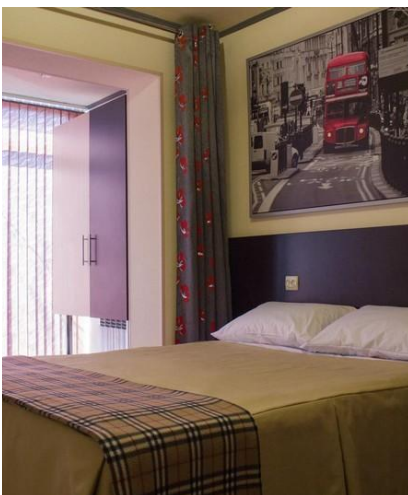
Pokój hotelowy w Murmańsku

Podczas naszej wyprawy będziemy przebywać za kotem podbiegunowym, czyli na terenach, gdzie zimą występuje noc polarna. W trakcie naszego pobytu słońce będzie pojawiać się na ok 2-4 godzin dziennie. Trzeba być więc przygotowanym na długie noce trwające mniej więcej od godziny 15 po południu do 11 przed południem.