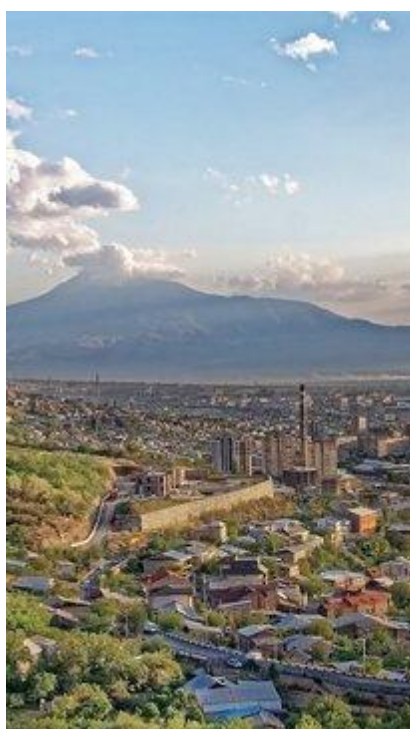
Otoczony górami Erywań będzie naszą bazą wypadową

Informacje praktyczne dla uczestników wyjazdu