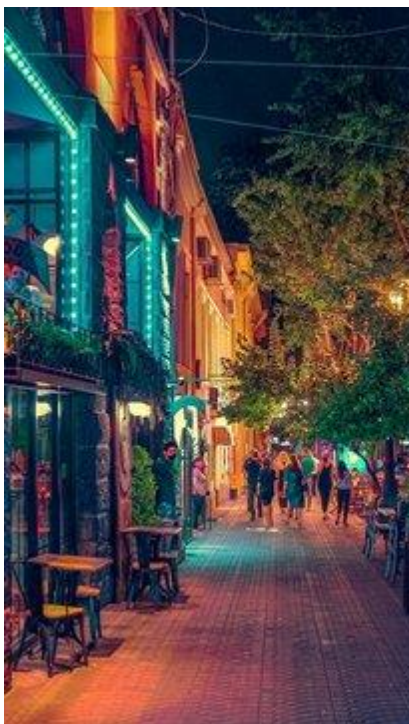
Stolica żyje również po zmroku

Dokumenty i pieniądze bezwzględnie muszą być głęboko schowane, najlepiej w specjalnych saszetkach czy pasach pod odzieżą - i należy je nosić zawsze przy sobie. Aparaty fotograficzne czy inne cenne przedmioty również nie powinny znajdować się np. w zewnętrznych kieszeniach plecaków. Złodzieje i kieszonkowcy nie śpią!