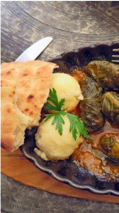
Dolma - jeden ze specjałów ormiańskiej kuchni

Jeśli chodzi o dolary, należy zabierać tylko najnowsze banknoty (z napisem Series 2009). Starsze nie są przyjmowane przez punkty wymiany walut. Banknoty, które chcemy wymienić na lokalną walutę i wpłacić pilotowi muszą być w idealnym stanie (zarówno dolary jak i euro).