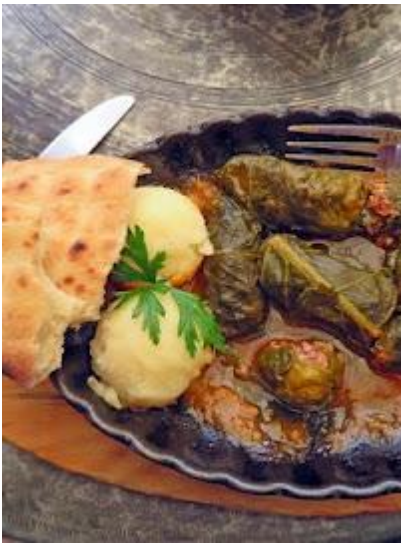
Dolma - jeden ze specjałów ormiańskiej kuchni

Bagaż główny do 23 kg, maksymalna suma wymiarów (długość, wysokość, szerokość) do 158 cm.