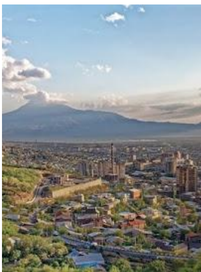
Otoczony górami Erywań będzie naszą bazą wypadową

Informacje praktyczne dla uczestników wyjazdu