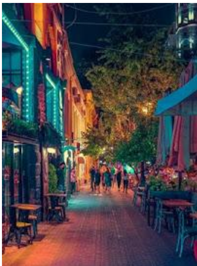
Stolica żyje również po zmroku