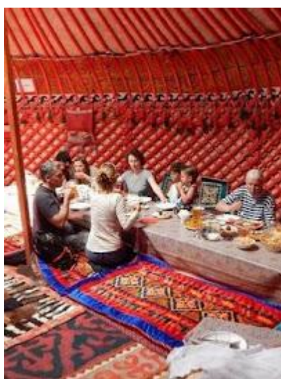
Tradycyjny posiłek w jurcie