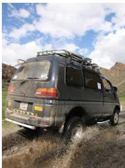
Takimi autami będziemy podróżować po Kazachstanie