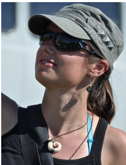
Na syberyjskie słońce najlepsze: czapka, okulary i krem z filtrem.