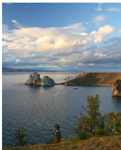
Latem pogoda nad Bajkałem bywa bardzo zmienna, więc warto nosić ze sobą kurtkę przeciwdeszczową.

W czasie tego wyjazdu nie będziemy podróżować po terenach uznawanych za szczególnie niebezpieczne. Na turystów będą czyhały typowe zagrożenia związane z pobytem w miastach (kieszonkowcy, ruch uliczny, nierówne chodniki).