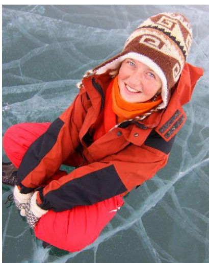
Najważniejsze w ekwipunku: Zestaw ciepłych ubrań