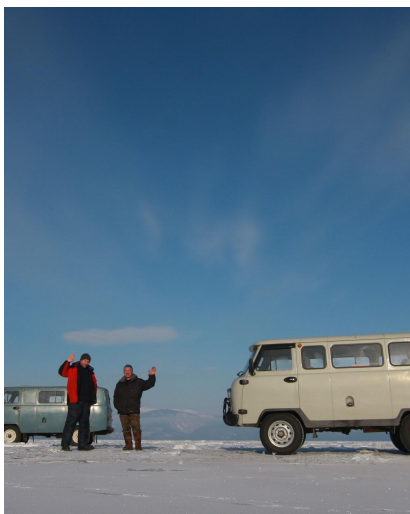
Błękitne niebo nad Bajkałem

Hotele w Irkucku i Krasnojarsku udostępniają gościom sieć wi-fi. Poza tym Internet dostępny wyłącznie przez telefon.