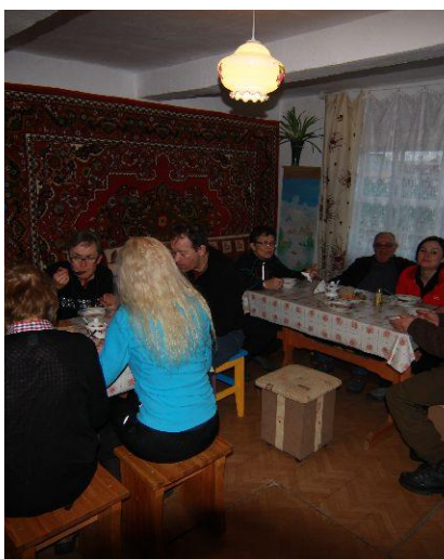
Kolacja na kwaterze prywatnej

Piszemy m.in. o warunkach podróżowania, klimacie, łączności telefonicznej i kursach walut, a także o niezbędnym ekwipunku.