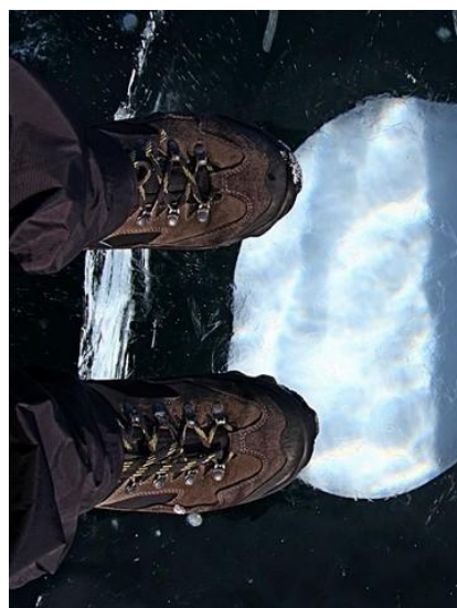
Bardzo ważne są odpowiednie, zaimpregnowane buty.

Szczególną uwagę należy zwrócić uwagę na obuwie. Nie bez powodu sugerujemy zabranie wysokich butów trekkingowych - będzie w nich ciepło (bo podeszwa jest gruba) i bezpiecznie (bo podeszwa ma dobrą przyczepność). Buty na płaskiej podeszwie (bez bieżnika) nie sprawdzą się! Przed wyjazdem buty warto zaimpregnować (przyklepiając się śnieg może tajać od ciepła stopy i but będzie przemakał).