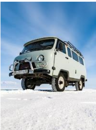
Takimi UAZ-ami jeździmy po Bajkale