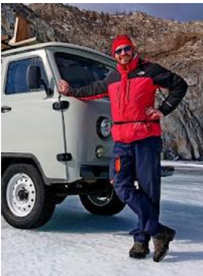
Ciepłe buty i odpowiednia odzież to podstawa zimowych wycieczek

W czasie pobytu na lodzie zalecamy korzystanie ze specjalnych antypoślizgowych nakładek na buty z metalowymi kolcami, które zapewniają znakomitą przyczepność.