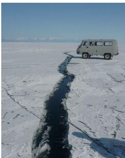
Szczelina lodowa na Bajkale