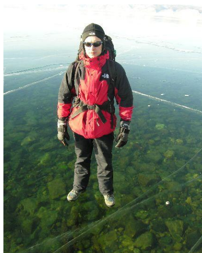
Odzież ma zatrzymywać ciepło i chronić nas przed wiatrem.