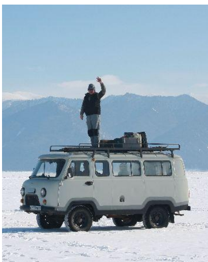
Takimi UAZ-ami jeździmy po Bajkale