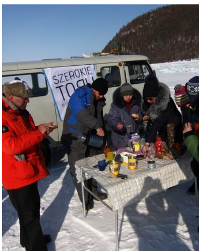
Piknik na środku Bajkału