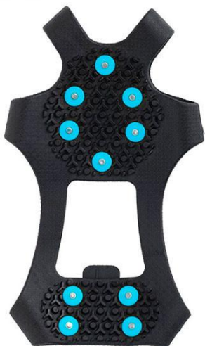
Antypoślizgowe nakładki na buty

Na wyjazd należy zabrać ze sobą podstawowe leki w małej ilości oraz wszelkie leki zapisane przez Państwa lekarza.