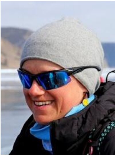
Okulary przeciwsłoneczne są niezbędne zimą na Syberii

W czasie pobytu na lodzie zalecamy korzystanie ze specjalnych antypoślizgowych nakładek na buty z metalowymi kolcami, które zapewniają znakomitą przyczepność.