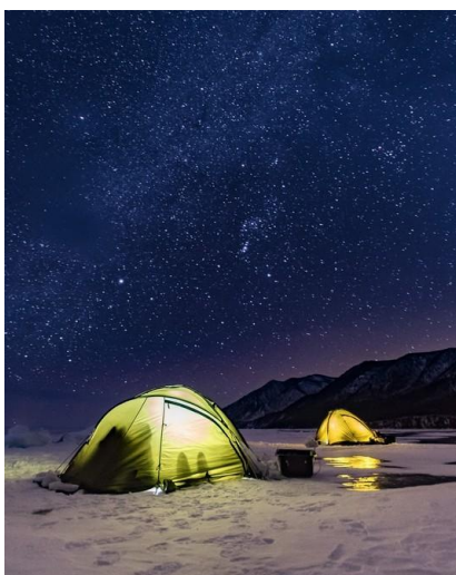
Nocleg w namiocie na lodzie

Piszemy m.in. o warunkach podróżowania, klimacie, łączności telefonicznej i kursach walut, a także o niezbędnym ekwipunku.