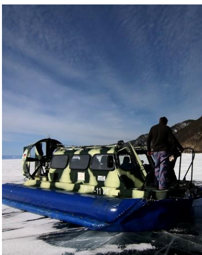
Takim poduszkowcem będziemy przemieszczać się po Bajkale