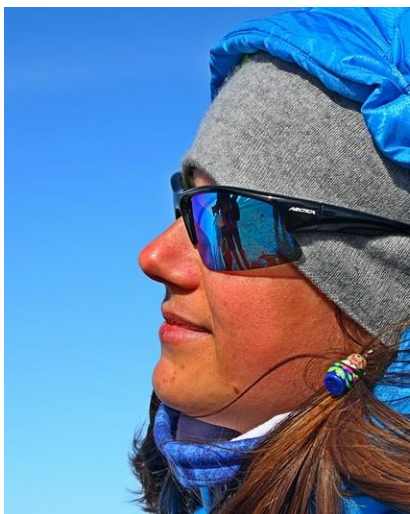
Okulary przeciwsłoneczne są niezbędne zimą na Syberii.

W czasie pobytu na lodzie zalecamy korzystanie ze specjalnych antypoślizgowych nakładek na buty z metalowymi kolcami, które zapewniają znakomitą przyczepność, oraz posiadanie kijów narciarskich (kupimy je w Irkucku).