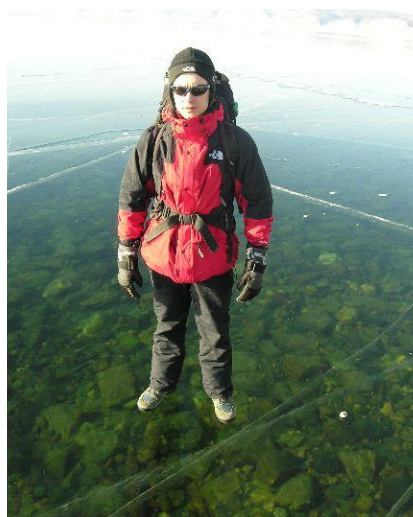
Odzież ma zatrzymywać ciepło i chronić nas przed wiatrem.