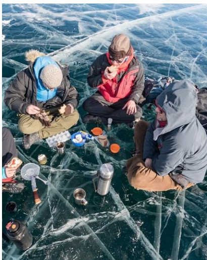
Piknik pośrodku Bajkału.