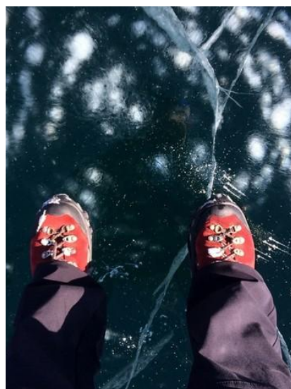
Bardzo ważne są odpowiednie, zaimpregnowane buty.