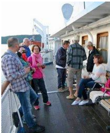
Podczas tej podróży większość czasu spędzimy na statku

Kontynuujemy rejs po Jeniseju. Podziwiamy nienaruszone krajobrazy, słuchamy opowieści Sybiraków, integrujemy się ze współpasażerami. Po drodze postój w zamieszkałej przez rybaków wiosce Bachtta. W drugiej połowie dnia wpływamy na Progi Osinowskie, gdzie tor wodny, wytyczony między skalistymi wyspami i podwodnymi skałami, jest tak wąski, że obowiązuje wahadłowy ruch statków. [S, O, K]