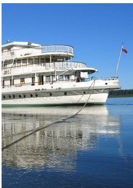
Statek Matrosow, na którego pokładzie spędzimy 5 dni

Prosimy ze szczególną uwagą zapoznać się z punktami dotyczącymi ekwipunku niezbędnego podczas tej wyprawy.