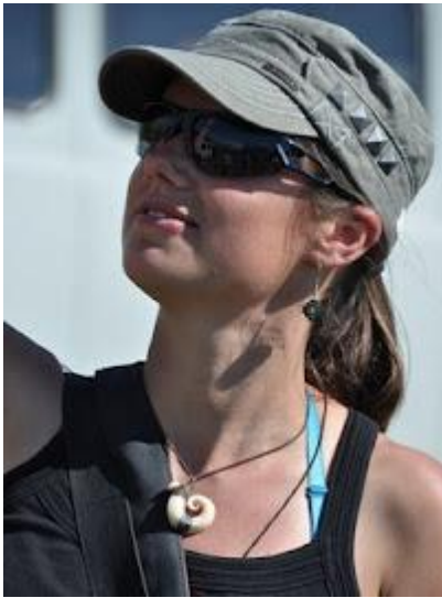
Na syberyjskie słońce najlepsze: czapka, okulary i krem z filtrem