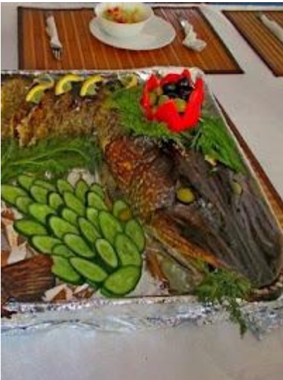
Specjały serwowane w restauracji na statku

Podczas rejsu należy pamiętać o zamykaniu kajuty na klucz.