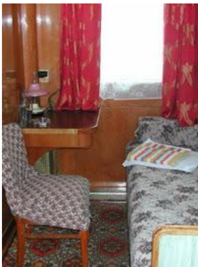
Wnętrze kajuty pierwszej klasy