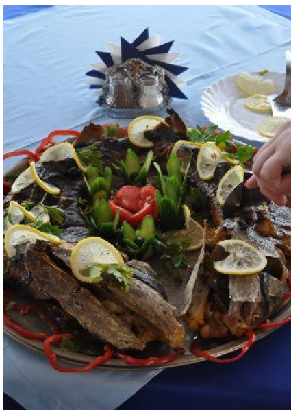
Specjały serwowane w restauracji na statku

Na własne potrzeby (posiłki niezawarte w cenie, kawę, piwo, pamiątki) należałoby wymienić ok. 100 USD/80 EUR . Albo więcej - w zależności od apetytu, pasji kolekcjonerskich czy szczodrości w obdarowywaniu krewnych i znajomych.