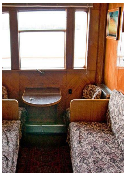
Wnętrze kajuty pierwszej klasy

Nie są wymagane żadne szczepienia obowiązkowe. Zalecane są szczepienia przeciwko dyfterytowi, tężcowi, gruźlicy, żółtacze typu A i B oraz kleszczowemu zapaleniu opon mózgowych. Na wyjazd należy zabrać ze sobą podstawowe leki w małej ilości oraz wszelkie leki zapisane przez Państwa lekarza.