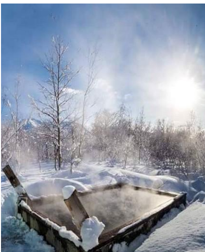
Dzikię gorące źródła