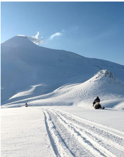
Przejazd skuterami pod Awaczyńską Sopkę

Piszemy m.in. o warunkach podróżowania, klimacie, łączności telefonicznej i kursach walut, a także o niezbędnym ekwipunku.