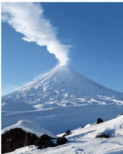
Aktywny wulkan na Kamczatce

Punkty wymiany walut i bankomaty będą dostępne tylko w Jelizowie i Pietropawłowsku Kamczackim. Kurs wymiany na Kamczatce jest raczej niekorzystny, więc tym bardziej polecamy zakup rubli w Polsce.