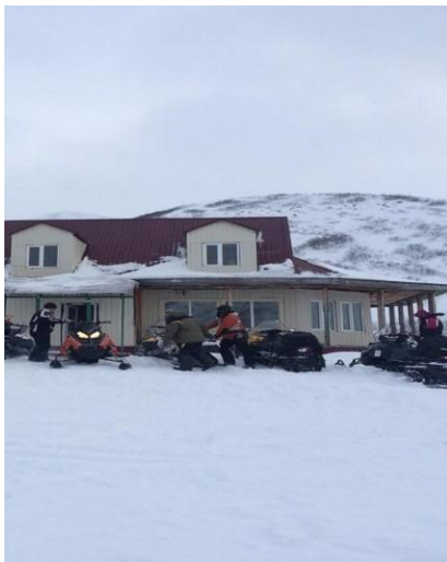
Baza turystyczna w dolinie rzeki Bannoj

Przed wyjazdem buty warto zaimpregnować (przylepiający się śnieg może tajeć od ciepła stopy i but będzie przemakał).