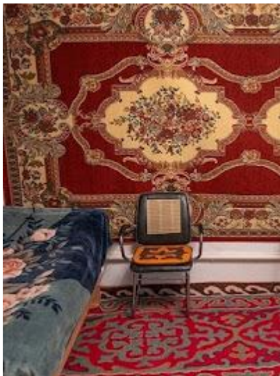
Kolorowy wystrój kirgiskich pensjonatów

Jeśli chodzi o dolary, należy zabierać tylko najnowsze banknoty (z napisem Series 2009). Starsze nie są przyjmowane przez punkty wymiany walut. Banknoty, które chcemy wymienić na lokalną walutę i wpłacić pilotowi muszą być w idealnym stanie (zarówno dolary jak i euro).