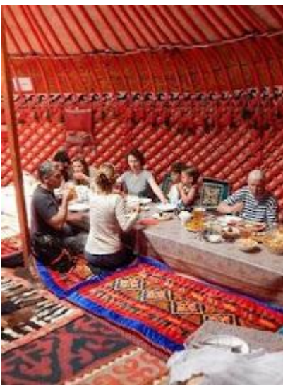
Tradycyjny posiłek w jurcie