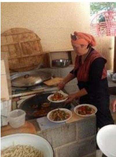
Domowe jedzenie gotowane przez gospodynie