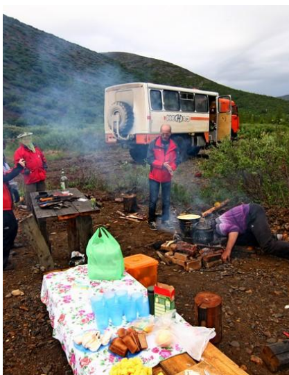
Niektóre posiłki będziemy jeść w warunkach polowych.