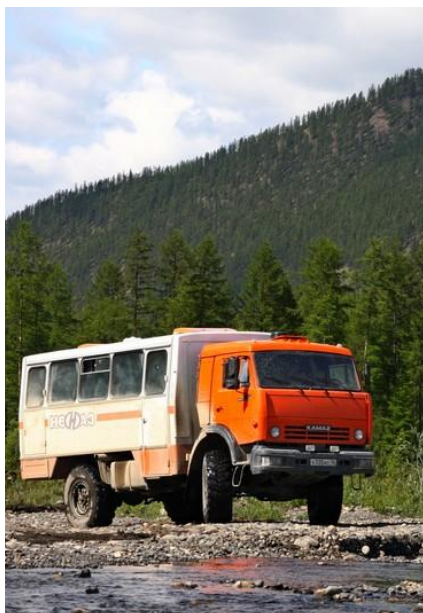
Kamaz - ciężarówka do przewozu osób.

Prosimy ze szczególną uwagą zapoznać się z punktami dotyczącymi ekwipunku niezbędnego podczas tej wyprawy.