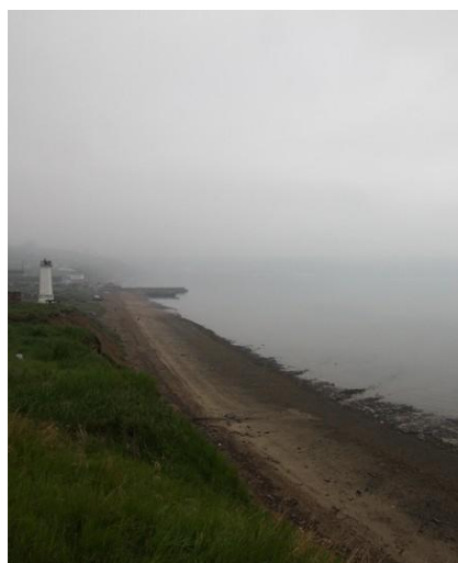
W Magadanie nawet latem może być mgliście, chłodno i wietrznie.