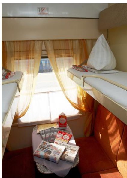
Czterooosobowy przedział w wagonie kupiejskim.