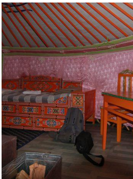
Wnętrze turystycznej jurty.

Wszystkie hotele, w których będziemy się zatrzymywać (tj. w Ułan Bator, Ułan Ude i Irkucku), udostępniają gościom bezpłatnie dostęp do internetu.