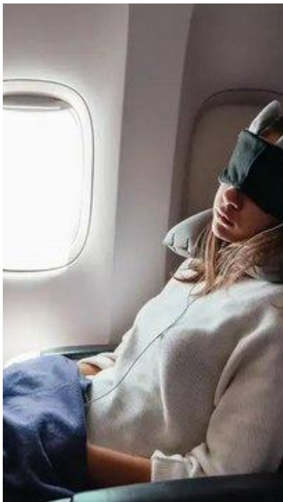
W czasie długich przelotów wygoda jest ważniejsza niż elegancja

W podróży znakomicie sprawdzają się spodnie z odpinanymi nogawkami, a pasek do spodni z plastikową klamrą bardzo ułatwia życie na lotniskach (nie trzeba go zdejmować przy kontroli bezpieczeństwa).