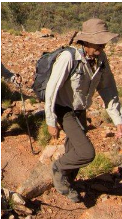
Nie wolno zapominać o dobrej ochronie przed słońcem i porządnych butach

Nie są wymagane żadne szczepienia obowiązkowe.