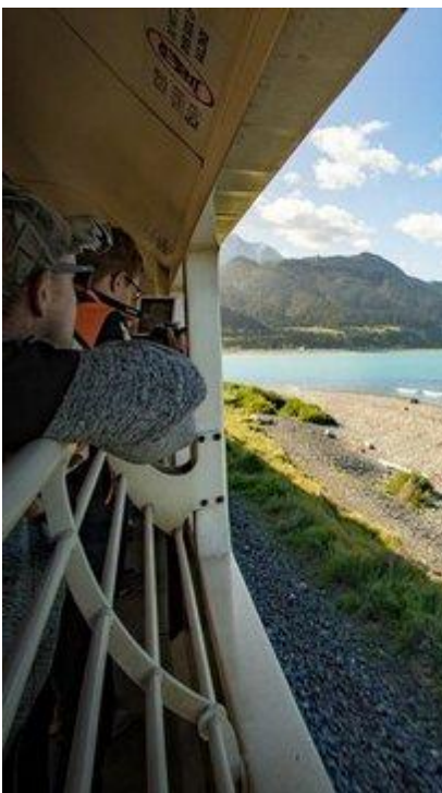
Otwarty wagon widokowy w składzie nowozelandzkich kolei

Informacje praktyczne dla uczestników wyjazdu