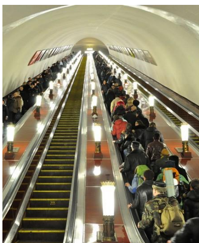
Tłok w metrze sprzyja złodziejom

Na wyjazd należy zabrać ze sobą podstawowe leki w małej ilości oraz wszelkie leki zapisane przez Państwa lekarza.