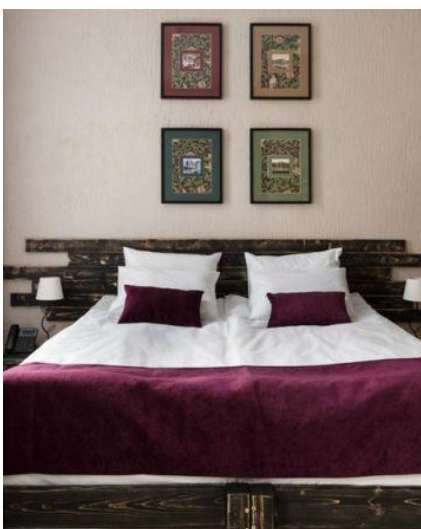
Wnętrze pokoju hotelowego w Petersburgu

Prosimy ze szczególną uwagą zapoznać się z punktami dotyczącymi ekwipunku niezbędnego podczas tej wyprawy.