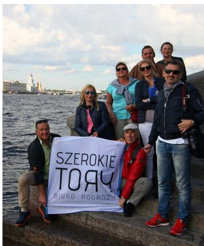
Podczas zwiedzania miast sporo będziemy chodzić pieszo, więc niezbędne będą wygodne, sprawdzone buty.