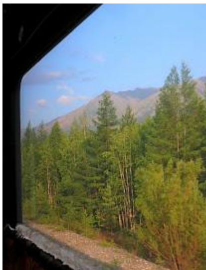
Bajkalsko-Amurska Magistrala zapewnia wspaniałe widoki z okna!