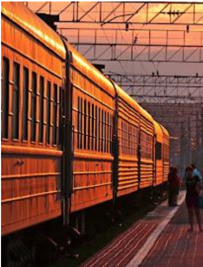
Podróż Koleją Transsyberyjską to niezapomniane przeżycie