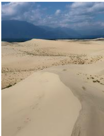
Czarskie Piaski to jedna z największych atrakcji na trasie

łodzią podwodną C-56. Następnie udamy się na autokarowy objazd miasta: pokonamy widowiskowe mosty, w tym największy na Wyspę Rosyjską oraz wjedziemy na punkt widokowy Orle Gniazdo. Wieczorem kolacja w restauracji i nocleg w hotelu. [S, K]