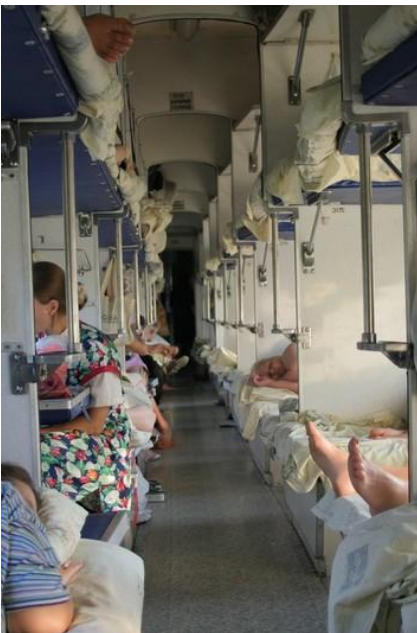
Wnętrze wagonu płackartnego

Prosimy ze szczególną uwagą zapoznać się z punktami dotyczącymi ekwipunku niezbędnego podczas tego wyjazdu.