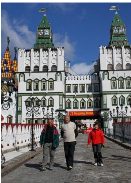
Podczas zwiedzania miast sporo będziemy chodzić pieszo, więc niezbędne będą wygodne, sprawdzone buty.