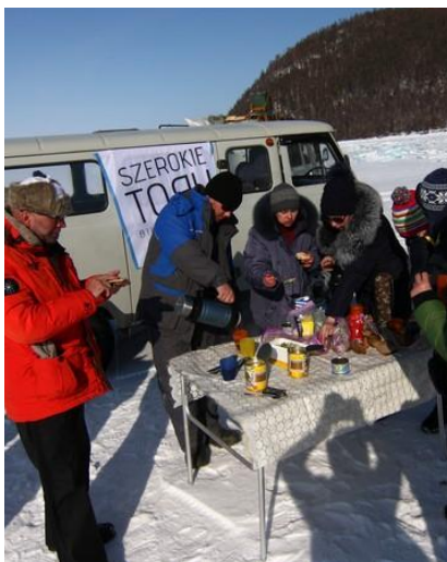
Piknik na środku Bajkału