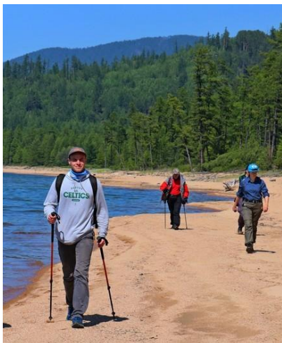
Trekking wzdłuż Bajkału