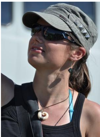
Na syberyjskie słońce najlepsze: czapka, okulary i krem z filtrem.

Na wyjazd należy zabrać ze sobą podstawowe leki w małej ilości oraz wszelkie leki zapisane przez Państwa lekarza.