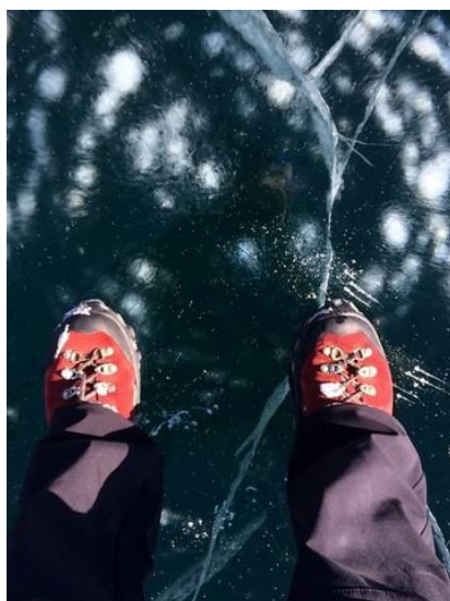
Bardzo ważne są odpowiednie, zaimpregnowane buty.