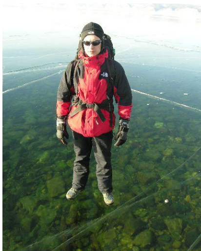
Odzież ma zatrzymywać ciepło i chronić nas przed wiatrem.