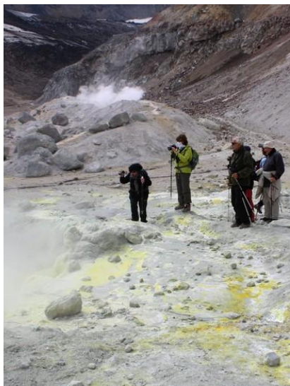
Po wulkanicznym podłożu wyjątkowo trudno się poruszać