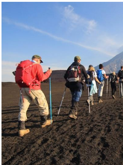
Na tej trasie bardzo ważny jest odpowiedni ekwipunek