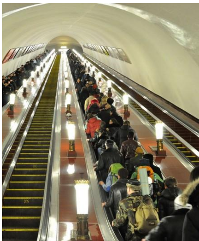
Tłok w metrze sprzyja złodziejom.

Na wyjazd należy zabrać ze sobą podstawowe leki w małej ilości oraz wszelkie leki zapisane przez Państwa lekarza.