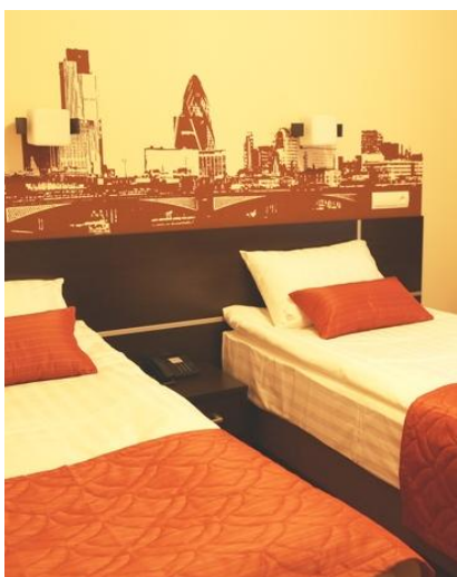
Pokój hotelowy w Moskwie

Prosimy ze szczególną uwagą zapoznać się z punktami dotyczącymi ekwipunku niezbędnego podczas tej wyprawy.