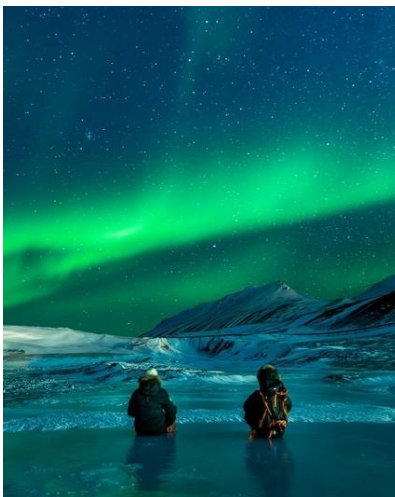
Długie noce sprzyjają obserwacji zorzy polarnej

Hotele w Murmańsku i w Kirowsku udostępniają gościom sieć wi-fi. Poza tym Internet dostępny jest wyłącznie przez telefon.