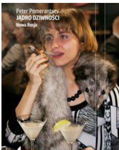
Jądro dziwności. Nowa Rosja