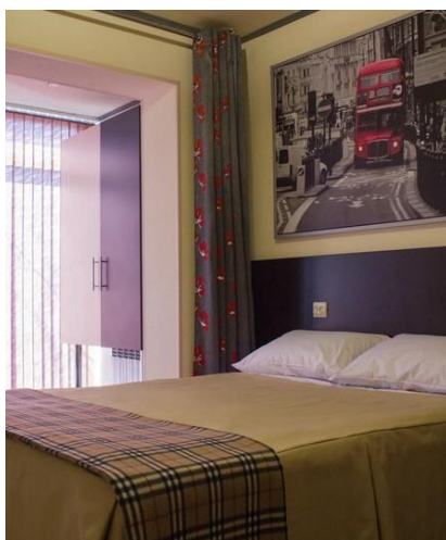
Pokój hotelowy w Murmańsku

Podczas naszej wyprawy będziemy przebywać za kotem podbiegunowym, czyli na terenach, gdzie zimą występuje noc polarna. W trakcie naszego pobytu słońce będzie pojawiać się na ok 2-4 godzin dziennie. Trzeba być więc przygotowanym na długie noce trwające mniej więcej od godziny 15 po południu do 11 przed południem.