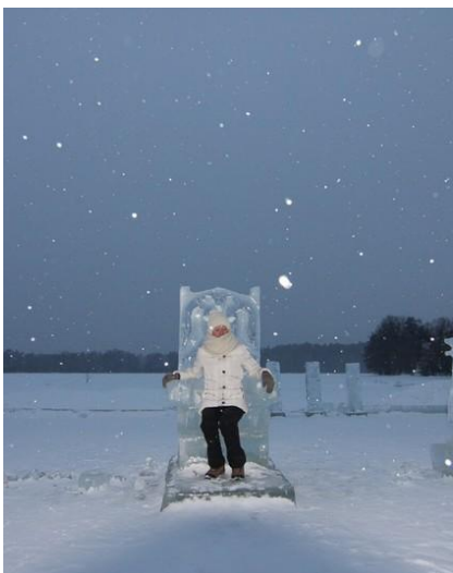
Ciepły strój to podstawa ekwipunku

Osobom mało odpornym na chłód radzimy zabranie specjalnej bielizny termicznej (kalesony, podkoszulka z długim rękawem), najlepiej z materiału z dodatkiem wełny (np. Icebreaker). Tego rodzaju odzież najściślej izoluje ciało przed zimnem.