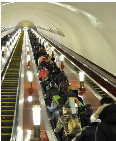
Tłok w metrze sprzyja złodziejom