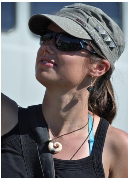
Na syberyjskie słońce najlepsze: czapka, okulary i krem z filtrem.