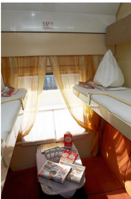
Czterooosobowy przedział w wagonie kupiejskim

Prosimy ze szczególną uwagą zapoznać się z punktami dotyczącymi ekwipunku niezbędnego podczas tego wyjazdu.