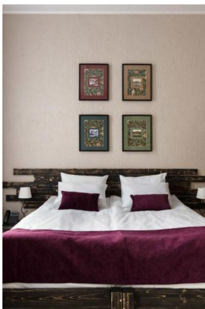
Wnętrze pokoju hotelowego w Petersburgu

Punkty wymiany walut i bankomaty będą we wszystkich odwiedzanych miastach.