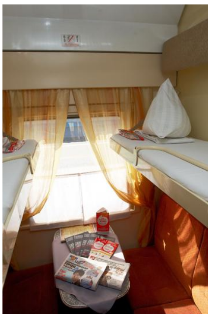
Czterooosobowy przedział w wagonie kupiejskim.

Prosimy ze szczególną uwagą zapoznać się z punktami dotyczącymi ekwipunku niezbędnego podczas tej wyprawy.