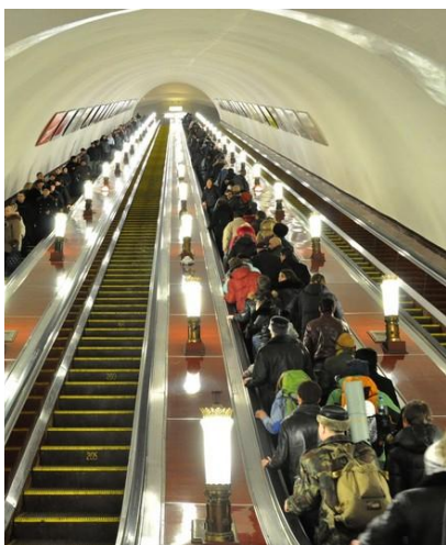
Tłok w metrze sprzyja złodziejom