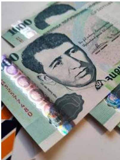
W obiegu są dwie serie banknotów.

Dokumenty i pieniądze bezwzględnie muszą być głęboko schowane, najlepiej w specjalnych saszetkach czy pasach pod odzieżą - i należy je nosić zawsze przy sobie. Aparaty fotograficzne czy inne cenne przedmioty również nie powinny znajdować się np. w zewnętrznych kieszeniach plecaków. Złodzieje i kieszonkowcy nie śpią!