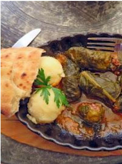
Dolma - jeden ze specjałów ormiańskiej kuchni

Jeśli chodzi o dolary, należy zabierać tylko najnowsze banknoty (z napisem Series 2009). Starsze nie są przyjmowane przez punkty wymiany walut. Banknoty, które chcemy wymienić na lokalną walutę i wpłacić pilotowi muszą być w idealnym stanie (zarówno dolary jak i euro).