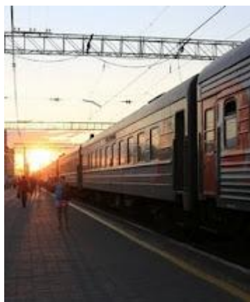
Z Irkucka do Moskwy będziemy jechać Koleją Transsyberyjską