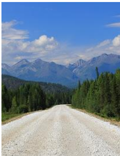
Dolina Tunkińska - piękne miejsce w okolicach Bajkału