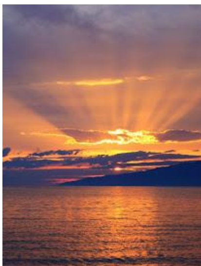
Nad Bajkałem można podziwiać wspaniałe zachody słońca

Rankiem przejazd do Sludianki. Tam na stacji kolejowej zobaczymy jedyny na świecie dworzec kolejowy zbudowany z marmuru. Następnie wyjazd pociągiem Kolei Transsyberyjskiej do Ułan Ude - trasa wiedzie wzdłuż Bajkału i jego największego dopływu, Selengi. Po południu wizyta w Tarbagataju u zabajkalskich starowierców, których kultura niematerialna jest wpisana na listę światowego dziedzictwa UNESCO. Zwiedzimy tam muzeum-lapidarium i odbudowaną cerkiew oraz wysłuchamy koncertu tradycyjnych ruskich pieśni w unikatowym polifonicznym wykonaniu. Spróbujemy również tradycyjnych dań. Nocleg w hotelu. [S, K]