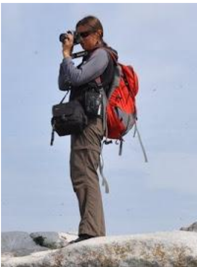
Mały plecak idealnie sprawdzi się jako bagaż podręczny do samolotu, przyda się także podczas codziennego zwiedzania i pieszych wędrówek

W podróży znakomicie sprawdzają się spodnie z odpinanymi nogawkami, a pasek do spodni z plastikową klamrą bardzo ułatwia życie na lotniskach (nie trzeba go zdejmować przy kontroli bezpieczeństwa).