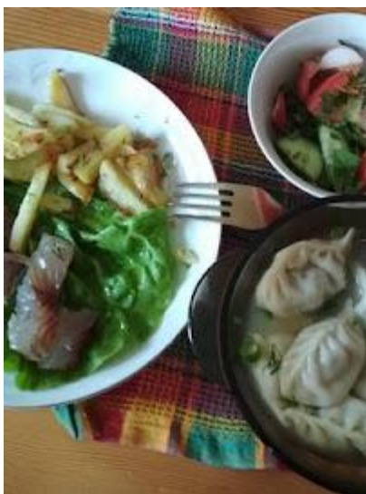
Kolacja na kwaterze prywatnej