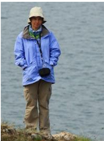
Pogoda bywa bardzo zmienna, więc warto nosić ze sobą kurtkę przeciwdeszczową

Na bieżąco będziemy informować o obostrzeniach związanych z COVID-19.