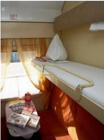
Czterooosobowy przedział w wagonie kupiejskim

Dokumenty i pieniądze bezwzględnie muszą być głęboko schowane, najlepiej w specjalnych saszetkach czy pasach pod odzieżą - i należy je nosić zawsze przy sobie. Aparaty fotograficzne czy inne cenne przedmioty również nie powinny znajdować się np. w zewnętrznych kieszeniach plecaków. Złodzieje i kieszonkowcy nie śpią!