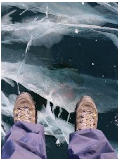
Bardzo ważne są odpowiednie, zaimpregnowane buty

W czasie pobytu na lodzie zalecamy korzystanie ze specjalnych antypoślizgowych nakładek na buty z