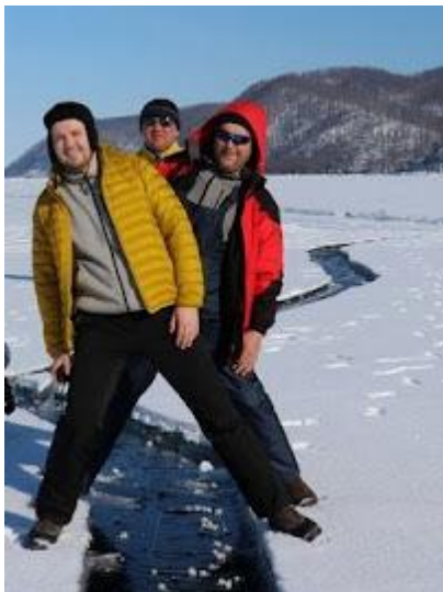
Szczelina lodowa na Bajkale