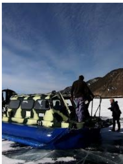
Takim poduszkowcem będziemy przemieszczać się po Bajkale