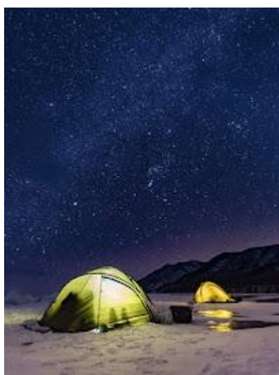
Nocleg w namiocie na lodzie