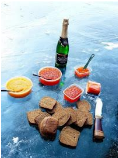
Piknik na środku Bajkału

Jeśli chodzi o dolary, należy zabierać tylko najnowsze banknoty (z napisem Series 2009). Starsze nie są przyjmowane przez punkty wymiany walut. Banknoty, które chcemy wymienić w Rosji i wpłacić pilotowi muszą być w idealnym stanie (zarówno dolary jak i euro).