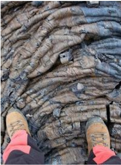
Po wulkanicznym podłożu wyjątkowo trudno się poruszać

W podróży znakomicie sprawdzają się spodnie z odpinanymi nogawkami, a pasek do spodni z plastikową klamrą bardzo ułatwia życie na lotniskach (nie trzeba go zdejmować przy kontroli bezpieczeństwa).