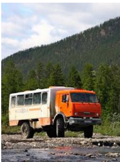
Kamaz - ciężarówka do przewozu osób