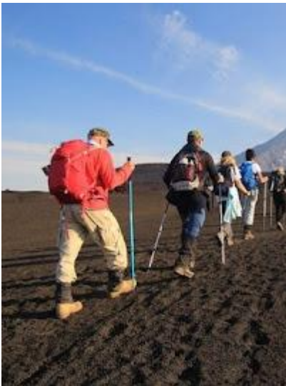
Na tej trasie bardzo ważny jest odpowiedni ekwipunek

W podróży znakomicie sprawdzają się spodnie z odpinanymi nogawkami, a pasek do spodni z plastikową klamrą bardzo ułatwia życie na lotniskach (nie trzeba go zdejmować przy kontroli bezpieczeństwa).