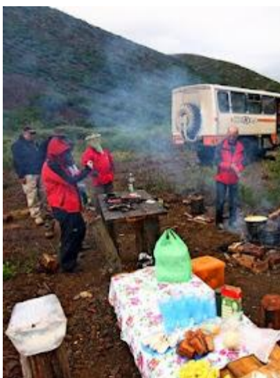
Niektóre posiłki będziemy jeść w warunkach polowych