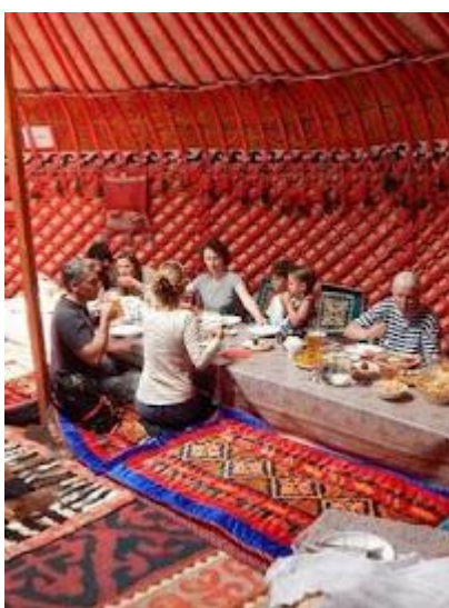
Tradycyjny posiłek w jurcie

Wyżej w górach może być chłodniej (szczególnie w nocy) i pogoda może być tam bardzo zmienna. Szczególnie dotyczy to okolic jeziora Songkol, gdzie