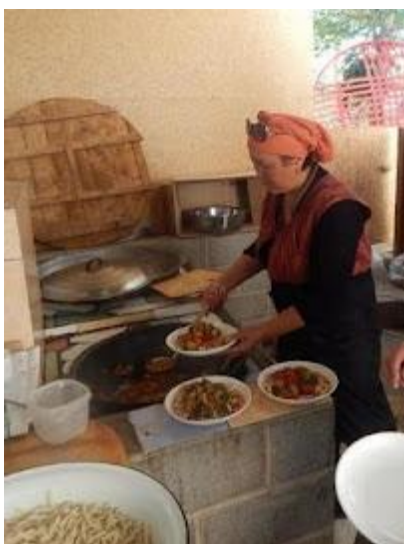
Domowe jedzenie gotowane przez gospodynie