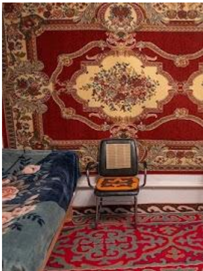
Kolorowy wystrój kirgiskich pensjonatów

Jeśli chodzi o dolary, należy zabierać tylko najnowsze banknoty (z napisem Series 2009). Starsze nie są przyjmowane przez punkty wymiany walut. Banknoty, które chcemy wymienić na lokalną walutę i wpłacić pilotowi muszą być w idealnym stanie (zarówno dolary jak i euro).