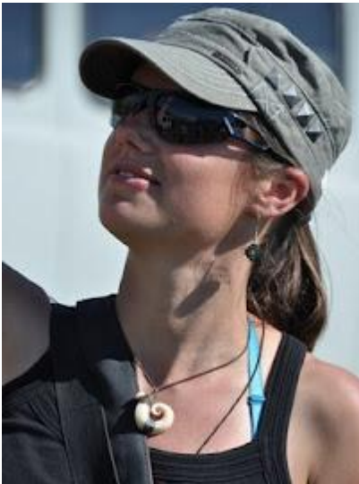
Na pustynne słońce najlepsze: czapka, okulary i krem z filtrem