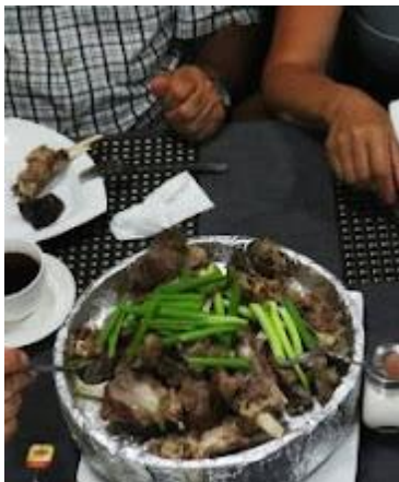
Na mongolskich stołach króluje mięso.

Jeśli chodzi o dolary, należy zabierać tylko najnowsze banknoty (z napisem Series 2009). Starsze nie są przyjmowane przez punkty wymiany walut. Banknoty, które chcemy wymienić na lokalną walutę i wpłacić pilotowi muszą być w idealnym stanie (zarówno dolary jak i euro).