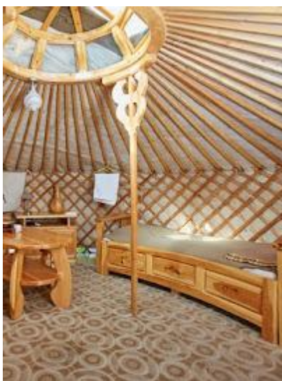
Wnętrze turystycznej jurty w Mongolii

Informacje praktyczne dla uczestników wyjazdu