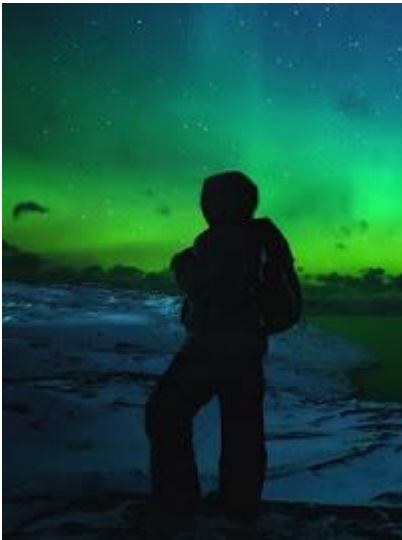
Długie noce sprzyjają obserwacji zorzy polarnej

Dokumenty i pieniądze bezwzględnie muszą być głęboko schowane, najlepiej w specjalnych saszetkach czy pasach pod odzieżą - i należy je nosić zawsze przy sobie. Aparaty fotograficzne czy inne cenne przedmioty również nie powinny znajdować się np. w zewnętrznych kieszeniach plecaków. Włódzieje i kieszonkowcy nie śpią!