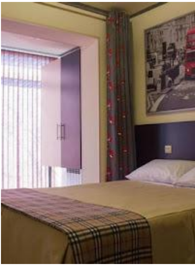
Pokój hotelowy w Murmańsku