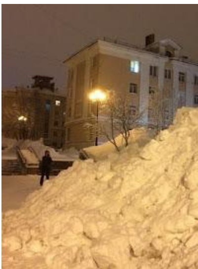
Śniegu potrafi być bardzo dużo.

Na bieżąco będziemy informować o obostrzeniach związanych z COVID-19.