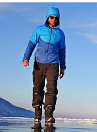
Najważniejsze w ekwipunku: zestaw ciepłych ubrań