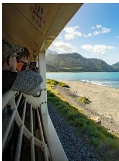
Otwarty wagon widokowy w składzie nowozelandzkich kolei

Informacje praktyczne dla uczestników wyjazdu