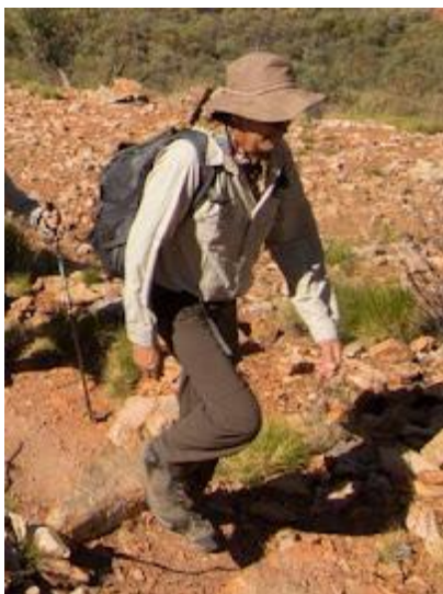
Nie wolno zapominać o dobrej ochronie przed słońcem i porządnych butach

Nie są wymagane żadne szczepienia obowiązkowe.