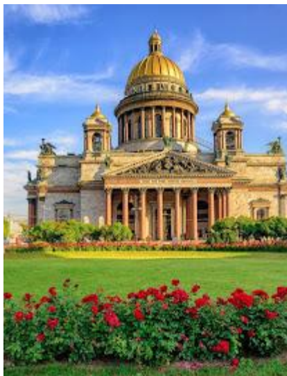
Architektura Petersburga może zachwycić!