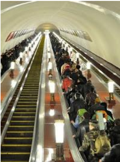
Tłok w metrze sprzyja złodziejom

Zabrania się przewożenia m.in. baterii, e-papierosów, zapalniczek benzynowych oraz zapalek kowbojskich w bagażu rejestrowanym. Listę przedmiotów, których nie wolno przewozić, należy sprawdzić przed każdym przelotem.