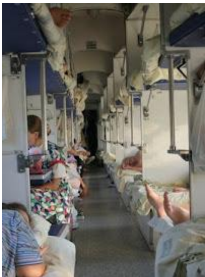
Wnętrze wagonu płackartnego