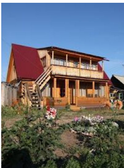
Bazy turystyczne są często skromne, ale panuje w nich domowa atmosfera.