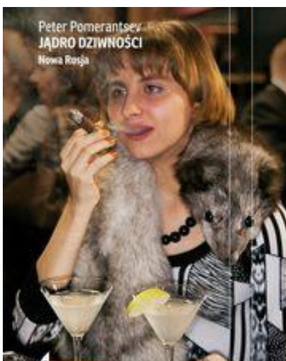
Jądro dziwności. Nowa Rosja