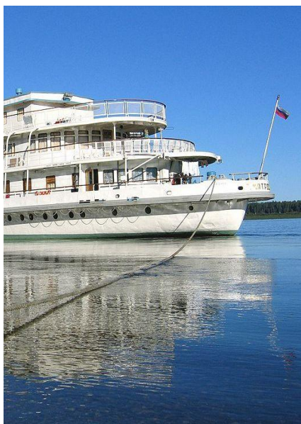
Statek Matrosow, na którego pokładzie spędzimy 5 dni

Nie są wymagane żadne szczepienia obowiązkowe. Zalecane są szczepienia przeciwko dyfterytowi, tężcowi, gruźlicy, żółtacze typu A i B oraz kleszczowemu zapaleniu opon mózgowych. Na wyjazd należy zabrać ze sobą podstawowe leki w małej ilości oraz wszelkie leki zapisane przez Państwa lekarza.