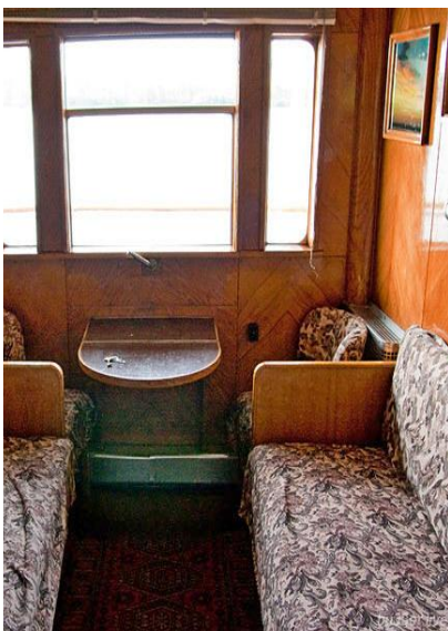
Wnętrze kajuty pierwszej klasy

Prosimy ze szczególną uwagą zapoznać się z punktami dotyczącymi ekwipunku niezbędnego podczas tej wyprawy.