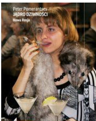
Jądro dziwności. Nowa Rosja

Polecamy kilka książek, które pozwolą przed wyjazdem zagłębić w tematykę Rosji i trochę lepiej rozumieć rzeczywistość, w której będziemy się poruszać: