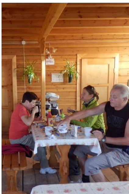
Domowe posiłki w bazach turystycznych przygotowują gospodynie.

Prosimy ze szczególną uwagą zapoznać się z punktami dotyczącymi ekwipunku niezbędnego podczas tej wyprawy.