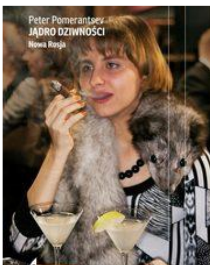
Jądro dziwności. Nowa Rosja

• Lew Gumilow Od Rusi do Rosji - szkice przedstawiające historię Rosji w aspekcie etnicznym, ukazują m.in. wpływ koczowniczych ludów Wielkiego Stepu na jej przebieg